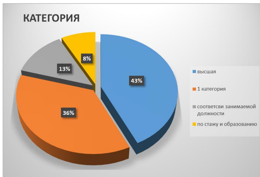
Диаграмма с характеристиками кадрового состава