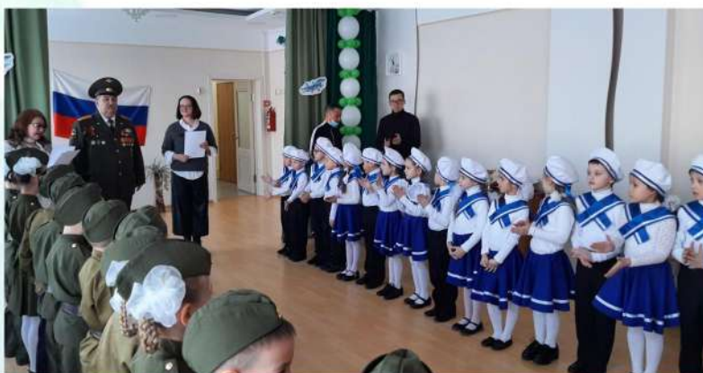
Смотр строя и песни февраль 2022 года