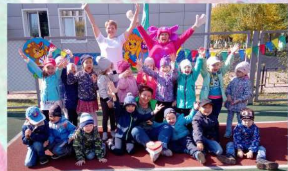
День Здоровья сентябрь 2019 года