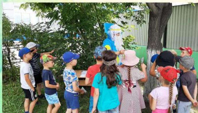
В царстве Берендея август 2022 года