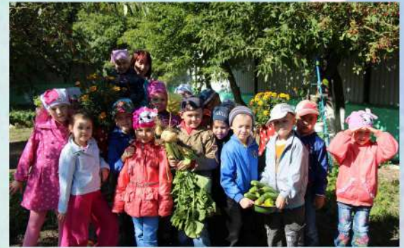
Наш урожай сентябрь 2014 года