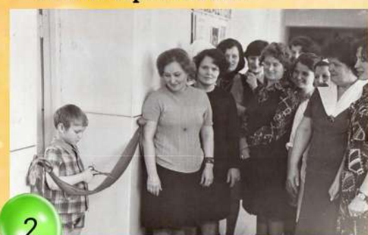
Открытие детского сада