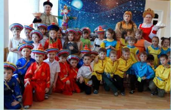
Сагаалган, Широкая Масленица февраль 2016 года