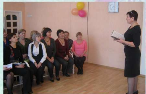
Педагогическая летучка ноябрь 2010 года