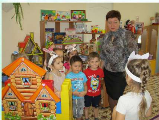
Театрализация "Теремок" 2020 год