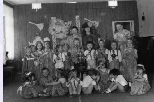
Русский народный праздник