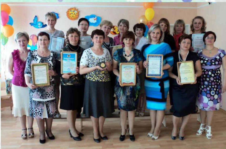
Наши награды май 2016 года