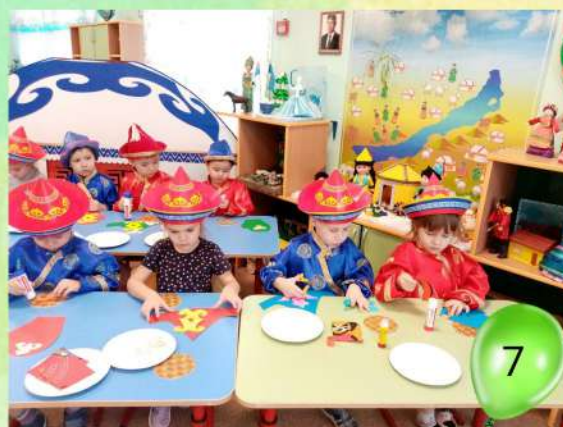
Февраль 2022 года