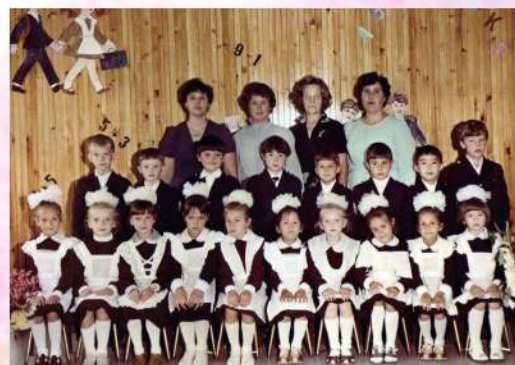
Выпускной утренник 1984 год