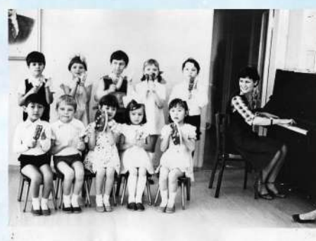
В музыкальном зале