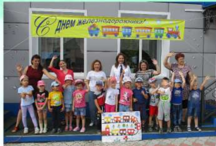
Август 2020 года