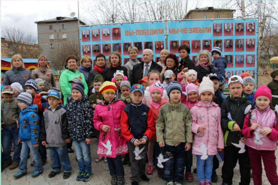
День Победы 2015 года