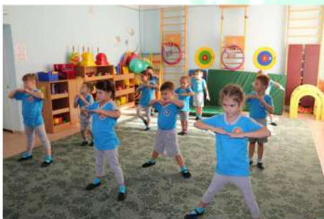
В спортивном зале 2018 год

В 2014 году 17 марта в соответствии с Федеральным законом Российской Федерации «Об образовании в Российской Федерации» от 29 декабря 2012 г. № 273 - ФЗ и распоряжением Открытого акционерного общества «Российские железные дороги» от 11 февраля 2014 г. № 368р, Негосударственное дошкольное образовательное учреждение «Детский сад № 232» ОАО «РЖД» переименовано в Частное дошкольное образовательное учреждение «Детский сад № 232 ОАО «РЖД».