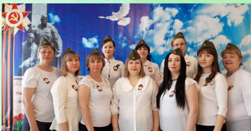
Май 2022 года