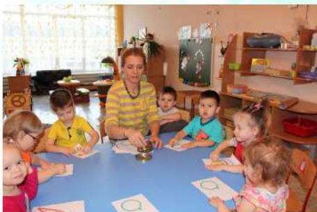
Вторая младшая группа 2014 год

Коллектив работал по новой современной программе развития и воспитания детей «Детство». Для реализации программы в детском саду были созданы все условия: эстетический центр, кабинет психокоррекции, физиокабинет, музыкальный и физкультурный залы.