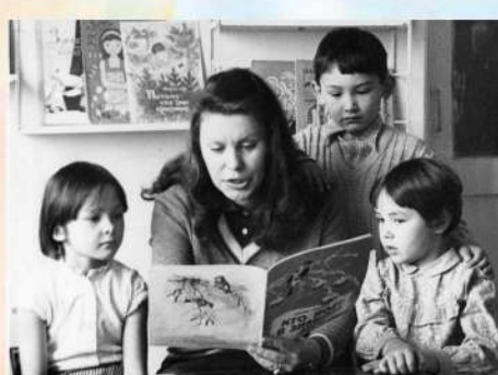
В группе детского сада