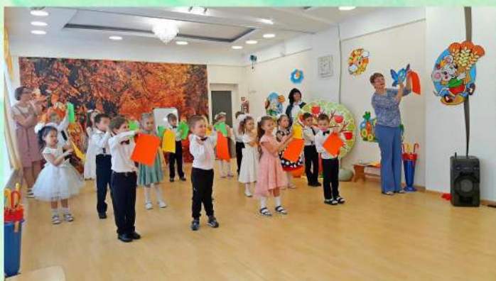
Праздник осени октябрь 2022 года