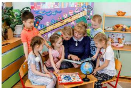
Группа "Мечтатели" 2022 год

Учреждение регулярно принимает участие в конкурсах разного уровня. Наши достижения за 2022 год: