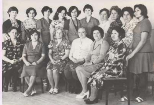
Коллектив ясли - сада № 145