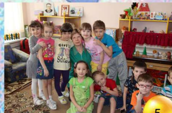
Старшая группа февраль 2014 года