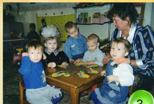
Первая младшая группа 2000 год

На основании распоряжения № 882р от 30.06.2003 председателя правительства РФ М. Касьянова имущество и издание Детского сада № 145 ст. Улан – Удэ было передано в уставной капитал ОАО «РЖД» и 14.10.2004 года Детский сад №145 прекратил свою деятельность.